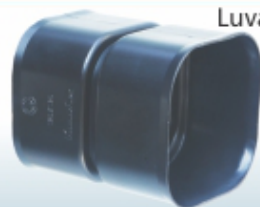
Luva de emenda