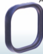
Anel de vedação

Os dados apresentados podem sofrer alterações sem aviso prévio.